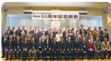
4月4日 珂友会 50周年記念総会及び祝賀会