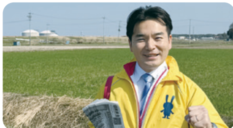
3月21日 ローラー活動in東海