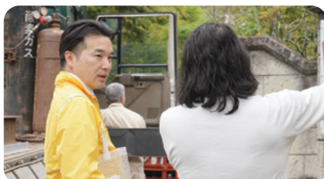
5月3日 G.W.山間部ローラー活動in日立