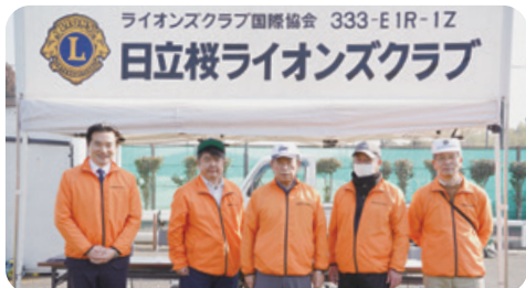
2月15日 日立桜ライオンズクラブサッカーイベント