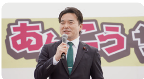
3月22日 第10回全国あんこうサミット