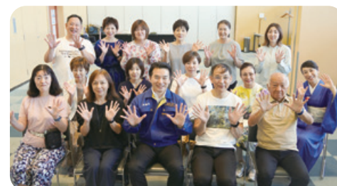
5月31日 桜きらめき会議「トーク&お話し会」