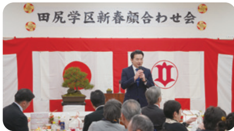
1月11日 田尻学区新春顔合わせ会