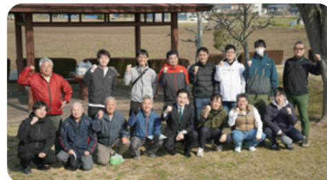
3月22日 東海合同ポスティング