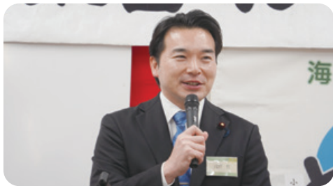
1月10日 豊浦地区新春顔合わせ