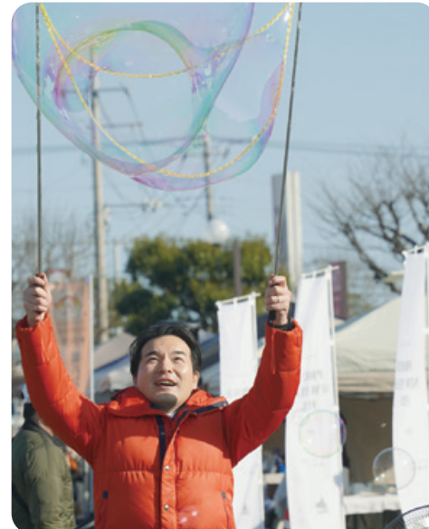
1月18日 高萩市PROUD NEW YEAR FES.