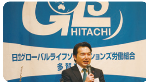
1月16日 日立GLS労組多賀支部結成80周年記念式典