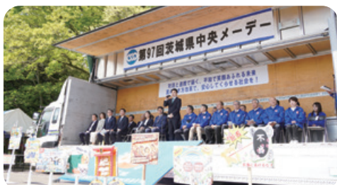
4月25日 第97回茨城県中央メーデー