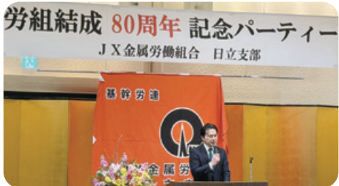
1月14日 JX金属労組日立支部結成80周年記念パーティ