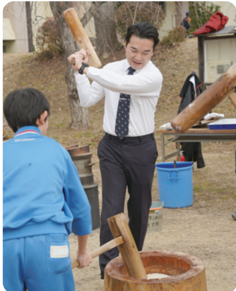
1月17日 日高ふれあい鳥追い祭り