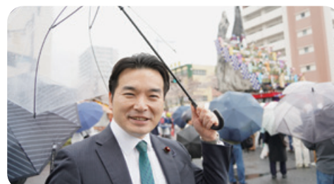
4月4日 第61回日立さくらまつり