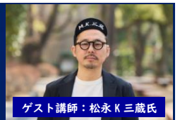
ゲスト講師：松永 K 三蔵氏

日時 2026年 5月17日(日) 14:00～17:30 (開場13:30) 場所 ホテル テラス ザスクエア 日立 日立市幸町1-20-3 構成 ● 後援会総会 14:00～15:00 参加対象：後援会会員のみ ● 励ます会【第一部】 15:10～16:00 講演者 松永K三蔵(まつながけい-さんそう)氏 2024年に「バリ山行」で第171回芥川賞を受賞 飯屋 未来をつくるのは人 ～東北地域活性化の挑戦～ ● 【第二部】 16:00～17:30