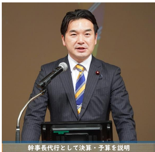
幹事長代行として決算・予算を説明

4月5日(日)、都内で国民民主党第6回定期党大会を開催しました。党幹事長代行として、2025年度決算・2026年度予算の報告を行うとともに、党所属議員700名をめざすことや、社会情勢の変化にあわせて党を進化させるための「『未来先取り綱領・政策アップデートチーム』」の設置を含め、大会議案が全会一致で採択されました。