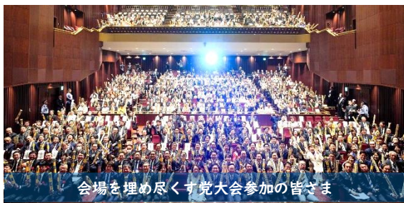
会場を埋め尽くす党大会参加の皆さま

4月5日(日)、都内で国民民主党第6回定期党大会を開催しました。党幹事長代行として、2025年度決算・2026年度予算の報告を行うとともに、党所属議員700名をめざすことや、社会情勢の変化にあわせて党を進化させるための「『未来先取り綱領・政策アップデートチーム』」の設置を含め、大会議案が全会一致で採択されました。