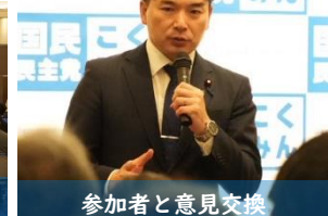
参加者と意見交換