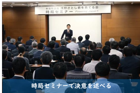
時局セミナーで決意を述べる