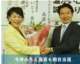
今井みちえ議員6期目当選