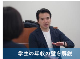
学生の年収の壁を解説

3月30日、桜きらめき会議の皆さまの企画で、トーク&交流会のイベントが日立シビックセンターで開催され、ご参加いただきました皆さまと意見交換をしました。今回は地域の人口減少対策や教育のあり方、働き方の新しい可能性、未来像についてご説明しました。