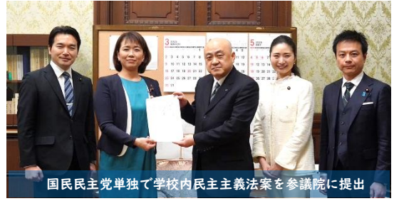
国民民主党単独で学校内民主主義法案を参議院に提出

3月18日に、学校内民主主義法案を参議院に提出しました。この法案は、児童生徒が声をあげても学校側は変わらないと感じている調査結果等を踏まえ、校則の制定・見直しをする際に、児童生徒・保護者の意見表明の機会確保や当該意見の考慮、情報公表等の措置を学校側に義務づけるものです。これにより、声をあげることや仲間をつくり変えていけることを体験し、「学校内民主主義」の実現をめざします。