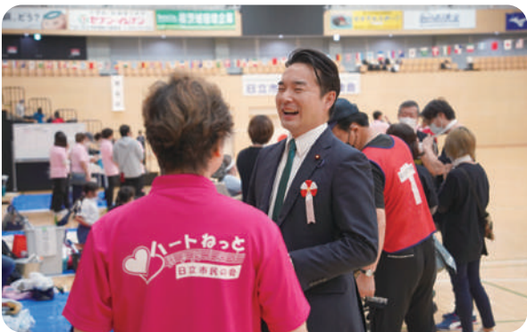
10月5日 第55回日立市ふれあい運動会