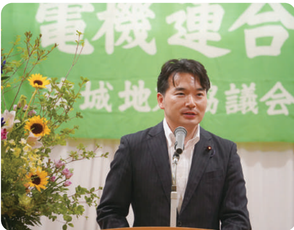
9月6日 電機連合茨城地協 結成70周年記念レセプション