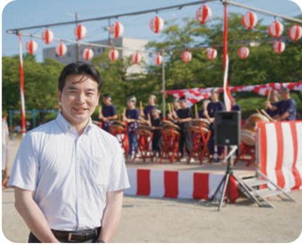
8月3日 中小路学区夏まつり2024