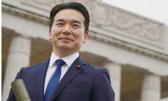
3期目の議員記章を胸に！

これからも、しっかりと地域の発展に向け、真面目に働く者が報われる公正な社会を実現するため、政策の実現に向けて取り組んでまいります。