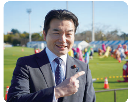
11月23日 東海I~MOのまつり