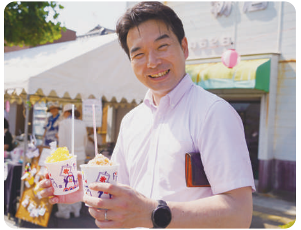
8月4日 日高おんもさ祭り