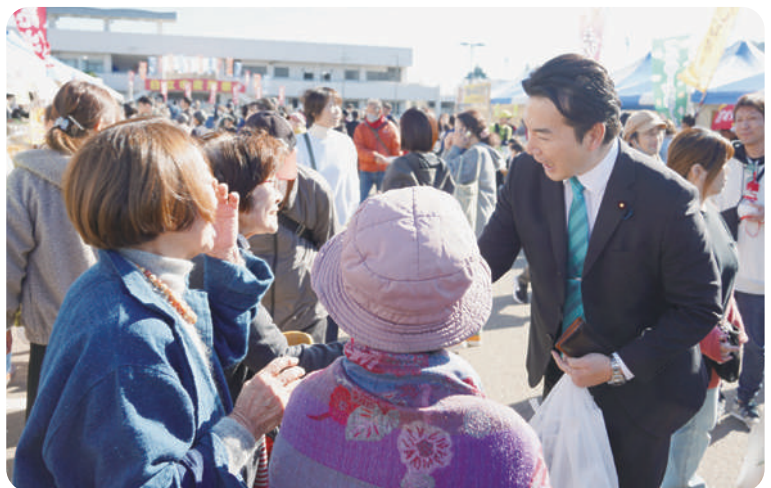
11月24日 日立市産業祭