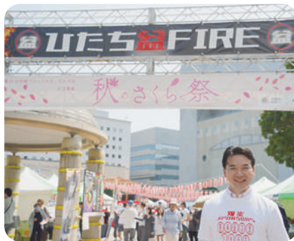
9月7日 ひたち盆FIRE2024 with体格祭