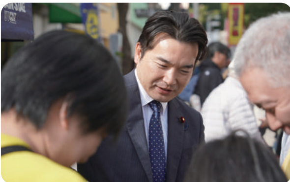
11月23日 二十三夜尊in銀座通り