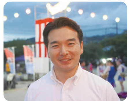
9月15日 仲町学区夏まつり