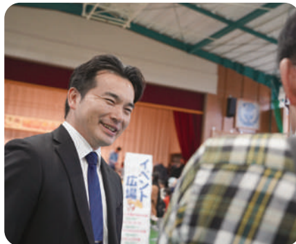
11月2日 塙山さんさん秋祭り