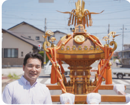
8月4日 第35回十王まつり