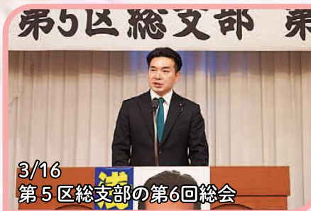
3/16 第5区総支部の第6回総会