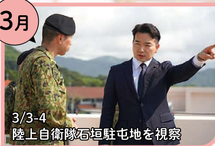
3/3-4 陸上自衛隊石垣駐屯地を視察