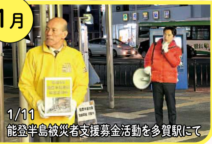
1/11 能登半島被災者支援募金活動を多賀駅にて