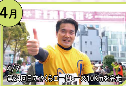
4/7 第24回日立さくらロードレース10Kmを完走