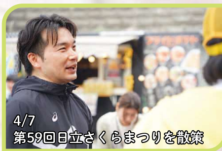
4/7 第59回日立さくらまつりを散策