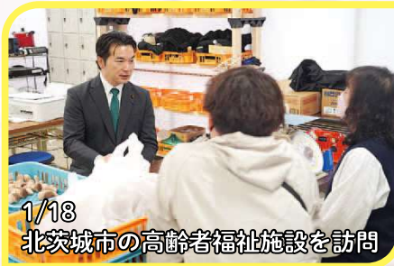
1/18 北茨城市の高齢者福祉施設を訪問