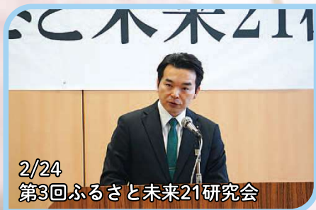
2/24 第3回ふるさと未来21研究会