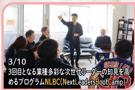
3/10 3回目となる業種多彩な次世代リーダーの知見を高めるプログラムNLBC(NextLeadersBootCamp)