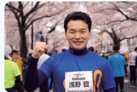
地元日立市で4年ぶりの開催となった日立さくらロードレースに参加、10キロ完走!(4/2)