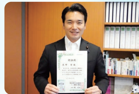
かねてから念願であった日本防災士機構から防災士の認証を取得することができました(5/25)