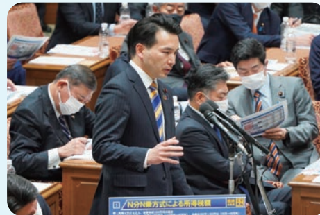
初めてテレビ中継入り予算委員会に質問者として登壇しました(1/31)