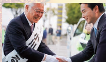
24年ぶりの市長選挙を制し3期目の当選を果たした小川春樹日立市長