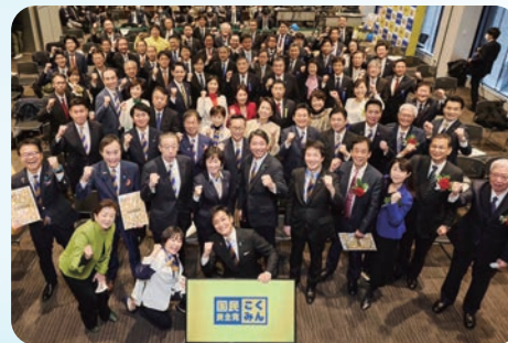
党大会が開催され地方選挙や衆議院解散総選挙の必勝に向けての活動方針等が確認されました(2/11)