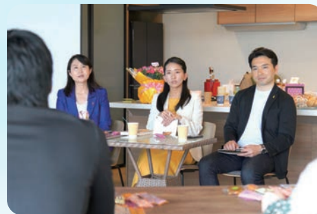
子育てタウンミーティングを開催、子育てや教育、障害者福祉、などについて、意見交換をしました(5/14)