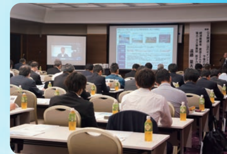
日本の原子力政策の最新動向について経産省よりご説明いただきました(6/3)