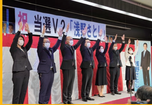
大切な一票を託していただきました皆さま、本当にありがとうございました。(10/31)

ご支援いただきました皆さまに改めて感謝申し上げるとともに、今後も現場主義を貫き一つの課題解決に全力を尽くす覚悟です。