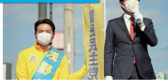
国民民主党 玉木雄一郎代表から激励をいただきました!(10/30)