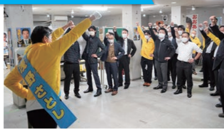
多くの支援者が街宣打上げに駆け付けました(10/27)