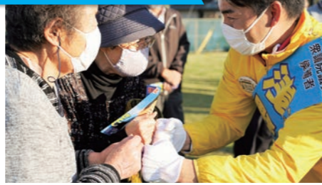
肌寒い中地域の方が街頭演説に来てくださいました(10/23)