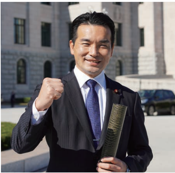
▲当選後初登院、国会議事堂前にて(11/10)