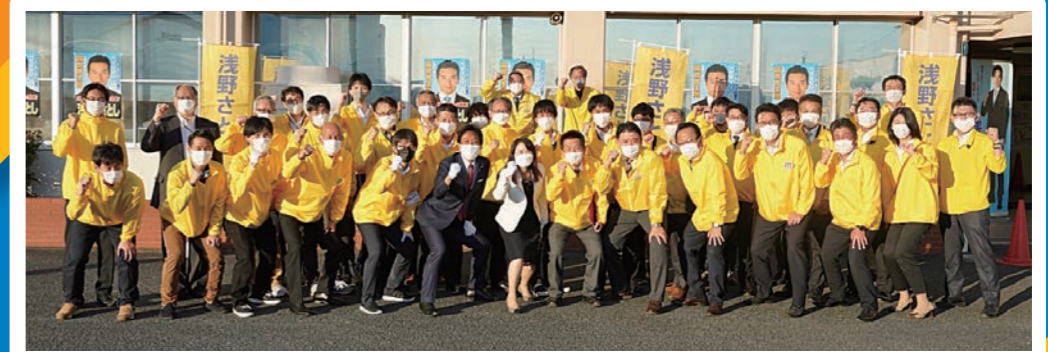
スタッフの皆さまのお陰で12日間の選挙を戦う事が出来ました。本当にありがとうございました。