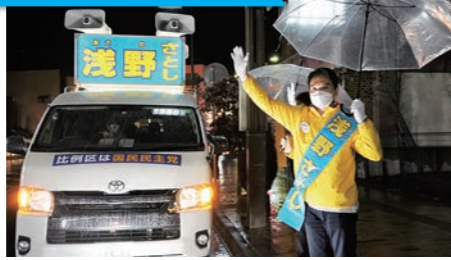
雨の中の街頭演説会でしたが多くの支援者が応援に駆け付けました(10/22)