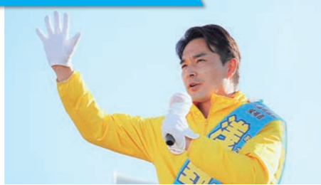
日本、そして東北発展に必要な政策を訴えさせていただきました(10/26)