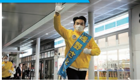
最後の最後まで諦める事なく走り抜きました(10/24)