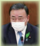
梶山経済産業大臣

マスクの生産数が高い設備、出荷までの日数が早い設備、人手を要しないことを満たす高性能な設備は 補助上限額を最大2億円とし、柔軟な対応をする。