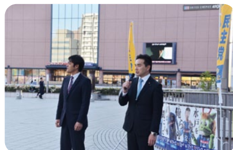
5月7日国民民主党結は結党1年を迎え各駅頭にて政治報告をしました。今後も、具体的な政策を示し社会の変化を望ましい方向へ導いてまいります。