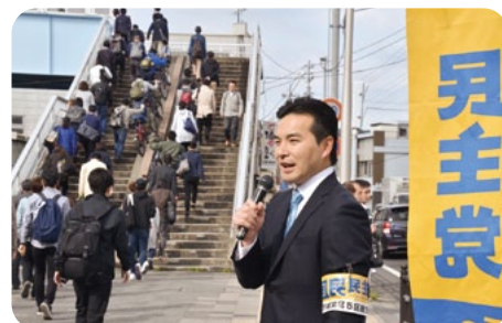
週初めは、駅頭で政治報告をしています。立ち止まって聞いて頂ける方も少しずつ増えています。今後も地域の方々との対話を大切にまいります。