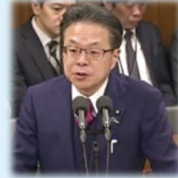
世耕経済産業大臣

「21%というのは、キャッシュレス事業者に聞き取りをして積算した割合であるが、制度スタート後は月単位でしっかりとモニタリングを繰り返す、必要であれば軌道修正を図っていく。」