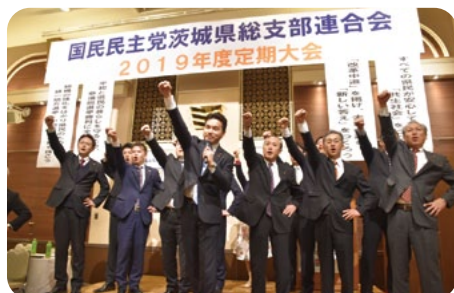
2月16日の定期大会において、国民民主党茨城県支部連合会の代表として承認いただきました。今後も所属議員とも連携を図り取組みをまいります。