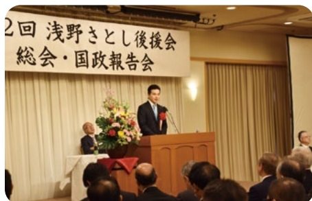
2月9日第2回後援会総会並びに国政報告会を開催しました。当日は、200名を超える方々に参加をいただき2019年度の活動内容が審議されました。