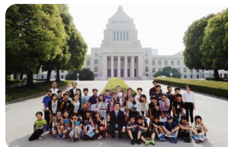
4月～5月にかけて小学生から大人の方まで多くの方に国会見学をしていただきました。国会議事堂にぜひお出でください。