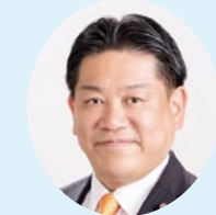
長野県 羽田 雄一郎