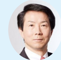
愛知県 大塚 耕平