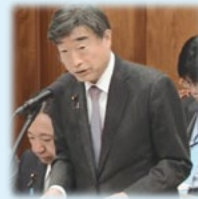
根本厚生労働大臣

「子どもたちの保育環境の安全確保の観点から、幼児教育無償化に関する協議の場を設け、しっかりとPDCAサイクルを回して取り組んでいく。」