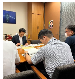
内閣府防災担当者と打合せ