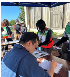
災害ボランティアとして活動