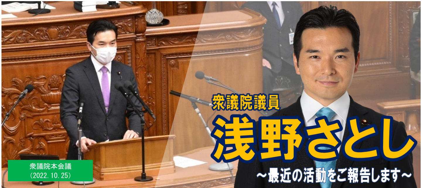
衆議院本会議 (2022. 10. 25)