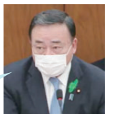
梶山経済産業大臣