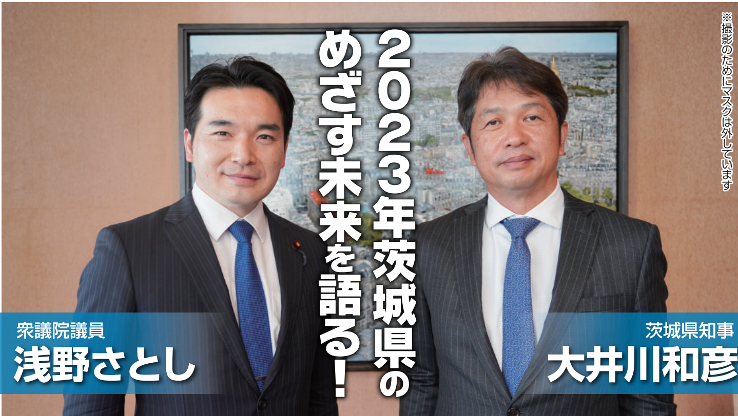
※撮影のためにマスクは外しています