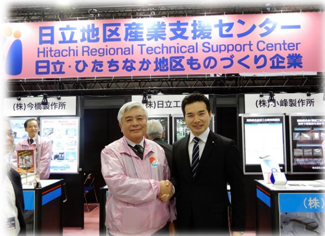
日立地区産業支援センターのブースにて

3月2日、スマートエネルギーWeek 見本市が東京ビッグサイトで開催されました。