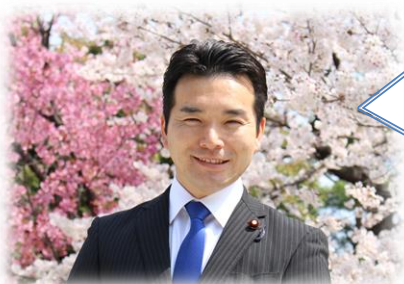
国会正面にて ~満開の桜~