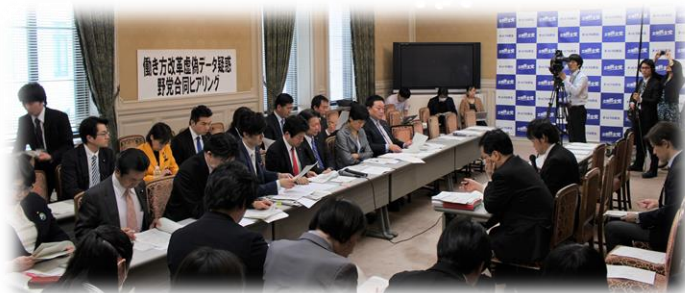
野党合同ヒアリングにて

今国会に提出を予定している労働基準法改正法案では「企画業務型裁量労働制の対象業務拡大」が削除されるが決まりましたが、「高度プロフェッショナル制度の創設」は残ったままです。